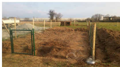
La future basse cour