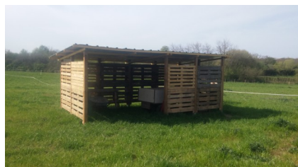
La maison des équidés