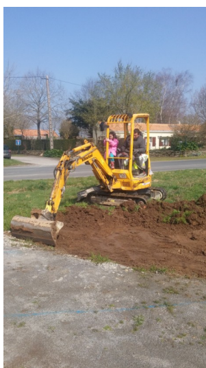
Le roi de la mini pelle !