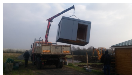
« livraison » des futurs toilettes sèches