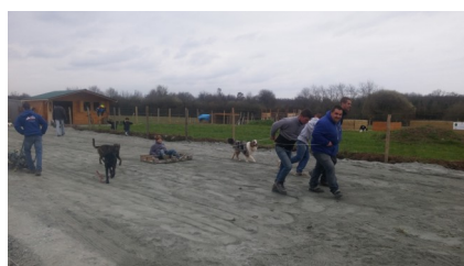
Technique pour aplanir le parking