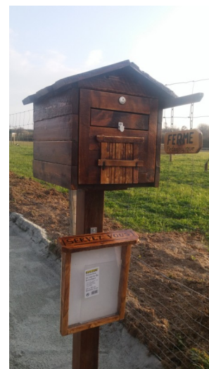
La belle boîte aux lettres !

LES MOUTONS : Nous avons accueillis 5 moutons de Ouessant : Black ( le papa, castré), Decker ( la maman) et leurs 3 filles : dora, ethel et fanny ! 4 moutons blancs ( un bélier et 3 brebis) sont venus diversifier et compléter notre troupeau . L'une d'elle s'appelle « rihanna »